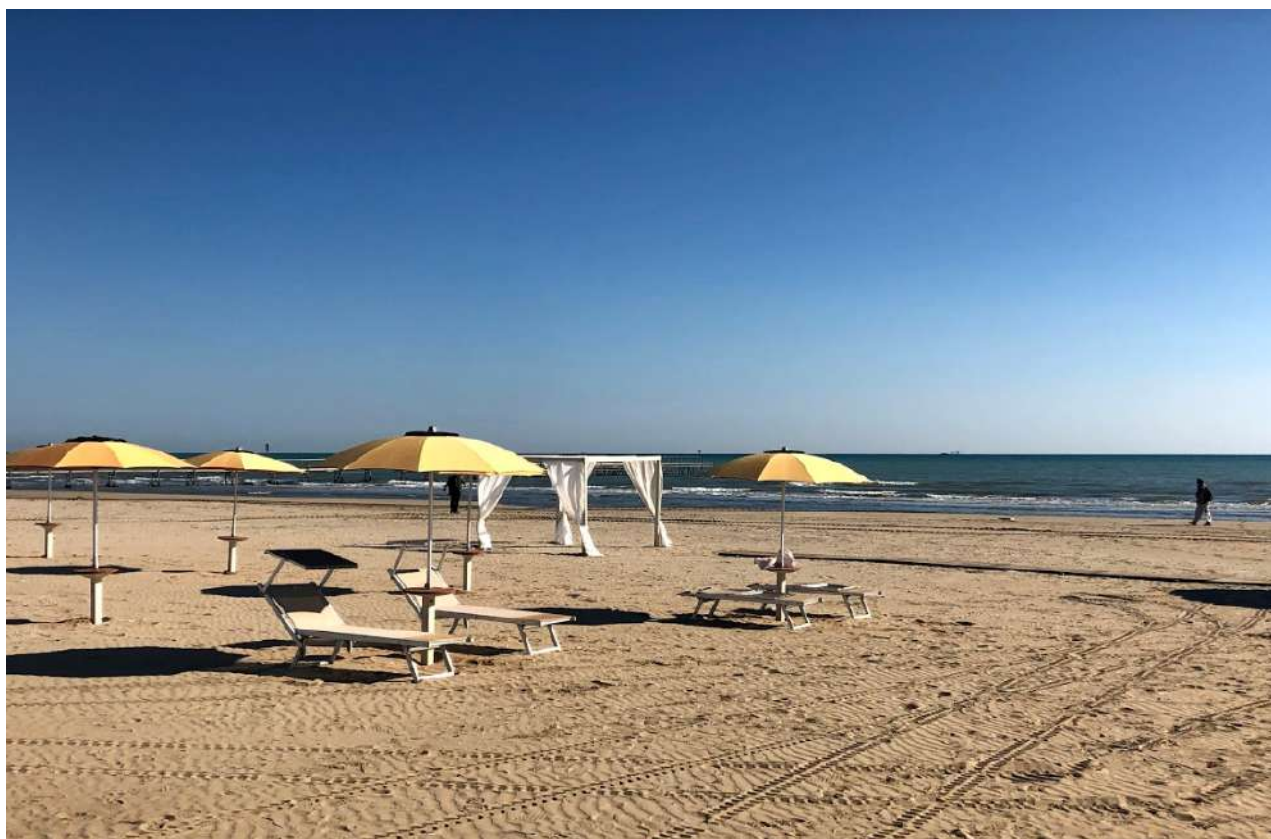
In prima fila i gazebo, sempre distanziati dagli ombrelloni